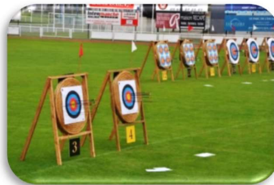
Compétition TAE 25 juin 2023 – Stade municipal de Balma