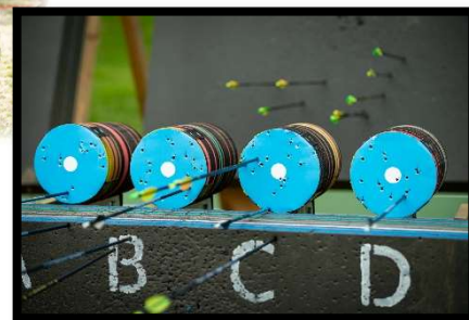
Compétition de Run Archery 9 juillet 2023 – Parc Lagarde Balma