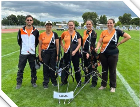
Equipe féminine D2 de Balma Blagnac – 2 juillet 2023