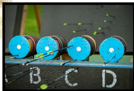
Compétition de Run Archery