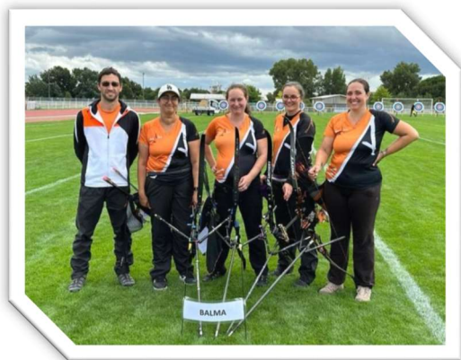
Equipe féminine D2 de Balma